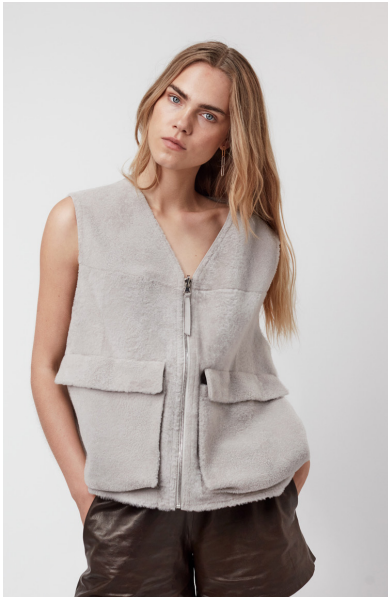
5636 VERBASCUM • Lacon Short Hair • KM-1732 • 630 Oyster • 650 € Baby Merino Sustainable • 590 €