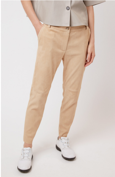
13513 PASSIFLORA • Ela Suede • 631 Hazelnut • 435 € • Ela Lamb • 480 € • Ela Lamb Color • 530 € • Ela Grass • 435 €