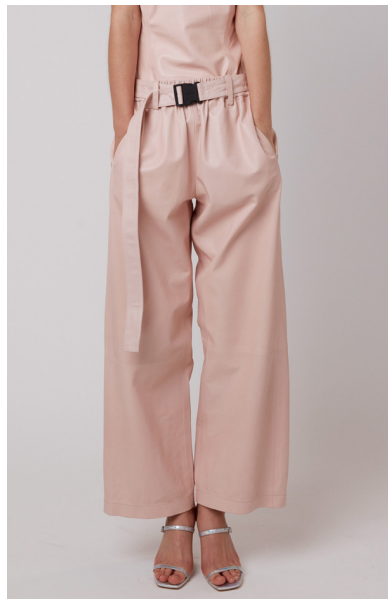
13509 PHACELIA • Sapphire Plongê Napa • DPE-856 • 53 Dusty Rose • 590 € HLS • DPE-568 • 10 Black • 450 €