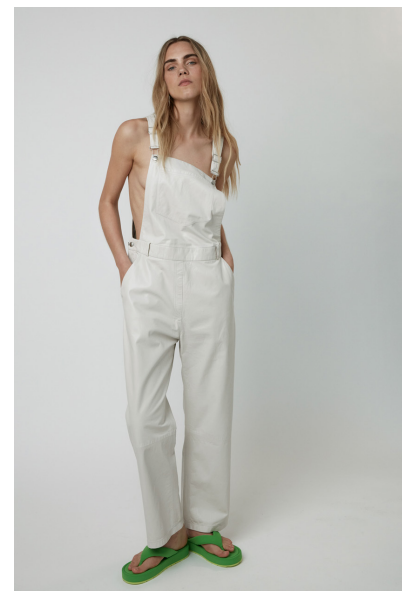
15760 BUTTERCUP • Lyra Ultra • DPE-874/03 • 27 Sugar • 690 € HLS • DPE-568 • 10 Black • 590 €