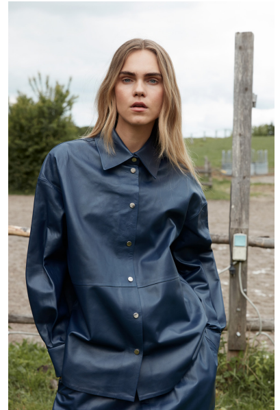
12520 SUN • Lyra Ultra • DPE-875/03 • 45 Insignia Blue • 690 € HLS • DPE-568 • 10 Black • 550 €