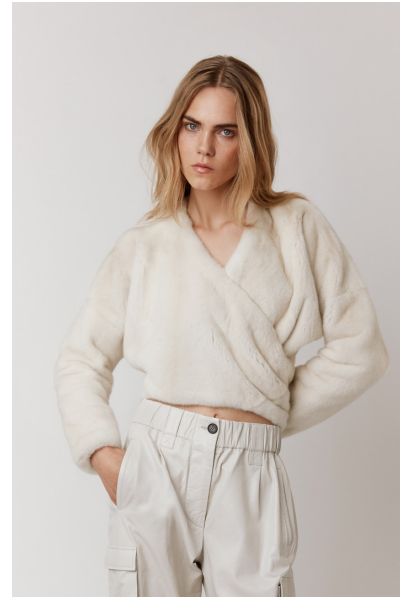
7182 VINCA • 21 Pearl • 1.695 €