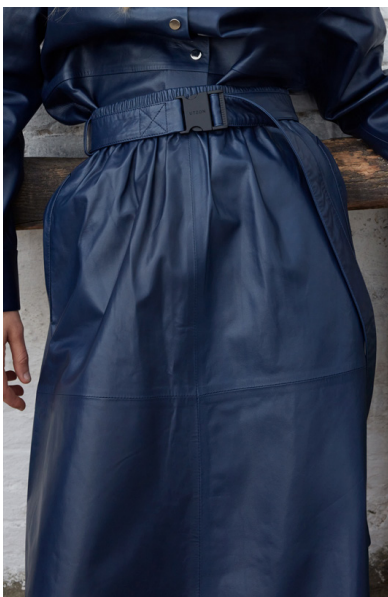
14412 NERINE • Lyra Ultra • DPE-875-03 • 45 Insignia Blue • 400 € HLS • DPE-568 • 10 Black • 380 €