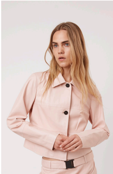
12517 JEWELWEED • Sapphire Plongê Napa • DPE-856 • 53 Dusty Rose • 490 € HLS • DPE-568 • 10 Black • 450 €