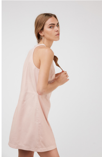
15762 DAHLIA • Sapphire Plongê Napa • DPE-856 • 53 Dusty Rose • 450 € HLS • DPE-568 • 10 Black • 350 €