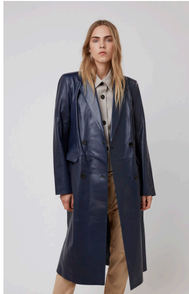
11336 COSMOS • Lyra • DPE-875 • 45 Insignia Blue • 850 € HLS • DPE-568 • 10 Black • 690 €