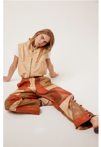
13515 POWDER • Leather Patchwork • 58 Dark Cheddar, 633 Toasted Coconut, 631 Hazelnut & 634 Primer • 700 €