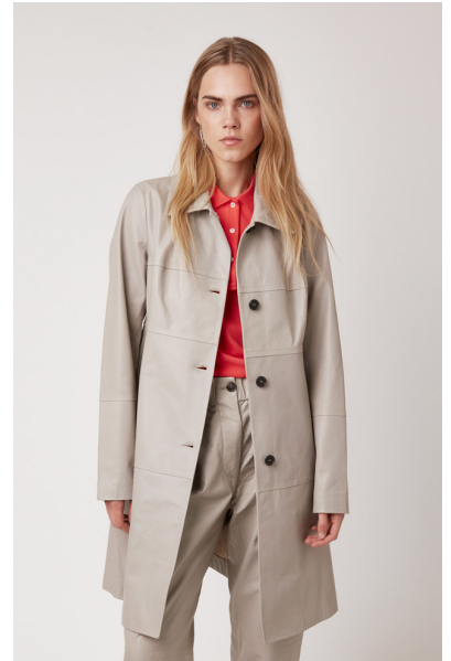
12516 JACOBINIA • Lyra • DPE-872 • 630 Oyster • 750 € HLS • DPE-568 • 10 Black • 600 €