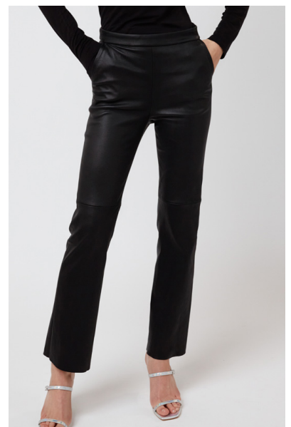
13512 LAVENDER • Ela Lamb • 10 Black • 480 € • Ela Lamb Color • 525 € • Ela Grass • 435 € • Ela Suede • 435 €