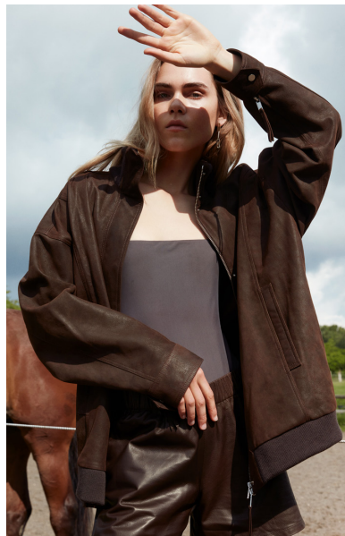
12509 JABOROSA • Ante Napa Pais Waxy Tan • DMP-223 • 632 French Roste • 590 € HLS • DPE-568 • 10 Black • 490 €