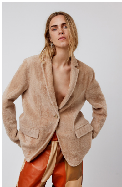
52310 JONQUIL • Lacon Short Hair • KM- 1730 • 631 Hazelnut • 890 € Baby Merino Sustainable • 790 €