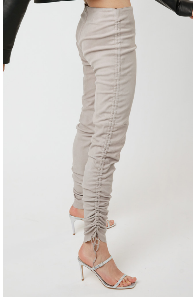
13514 LOTUS • Ela Lamb Grass • 53 Dusty Rose • 495 € Ela Suede • 495 €