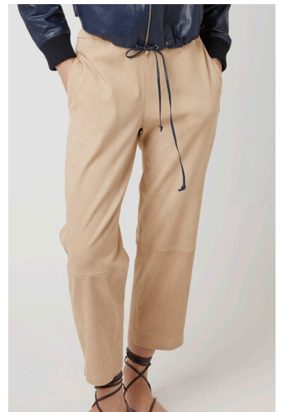
13505 PEONY • Ela Suede • 631 Hazelnut • 485 € • Ela Lamb • 535 € • Ela Lamb Color • 595 € • Ela Grass • 485 €