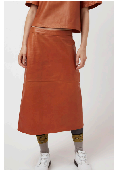
14411 NYMPEA • Lyra • DPE-876 • 58 Dark Cheddar • 450 € HLS • DPE-568 • 10 Black • 350 €