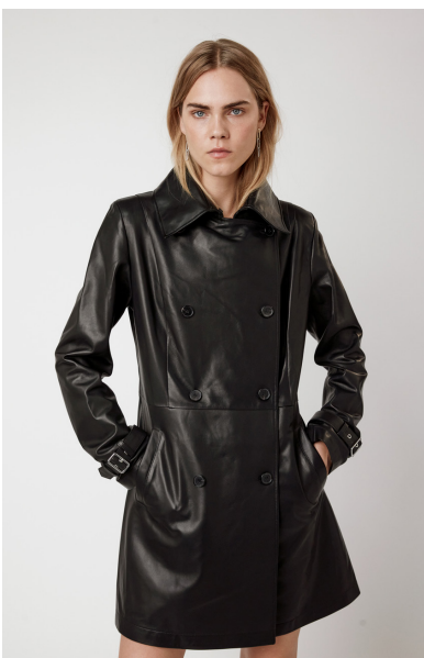
12511 JUSTICIA • Vendôme Plongê Napa • DPE-894 • 10 Black • 740 € HLS • DPE-568 • 10 Black • 590 €