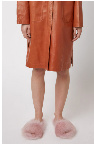
194 ALCHEMILLA • Toscana Straight Hair • KT-1618 • 59 Chewing Gum • 140 € Size 37-41