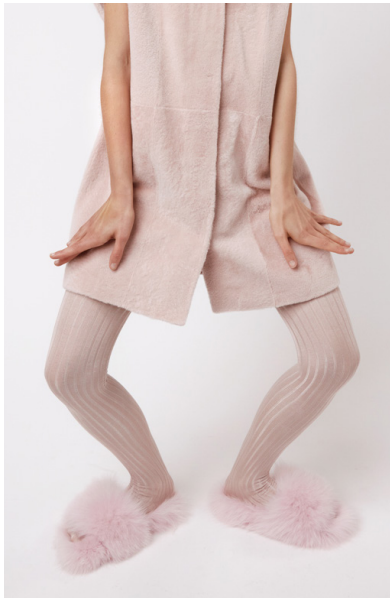
194 ALCHEMILLA • 59 Chewing Gum • 250 € Size 37-41