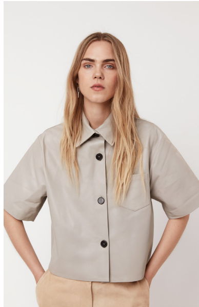
12519 SILENE • Lyra Ultra • DPE-872/03 • 630 Oyster • 480 € HLS • DPE-568 • 10 Black • 400 €