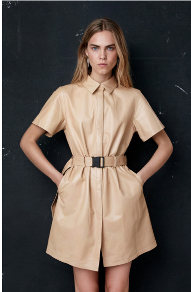
15761 DAFFODIL • Lyra Ultra • DPE-877/03 • 631 Hazelnut • 670 € HLS • DPE-568 • 10 Black • 550 €