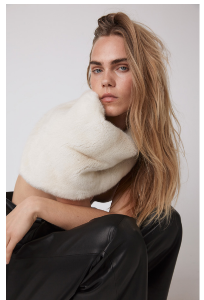
193 ALLIUM • 21 Pearl • 660 €