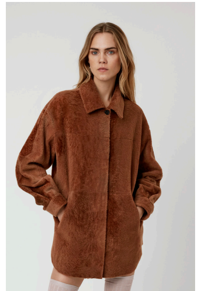
52231 SALLY • Lacon Short Hair • KM- 1731 • 633 Toasted Coconut • 890 € Baby Merino Sustainable • 750 €