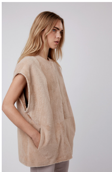
5628 VERNA • Lacon Short Hair • KM- 1730 • 631 Hazelnut • 690 € Baby Merino Sustainable • 600 €