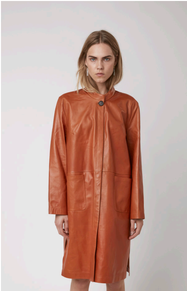
11335 CAMELIA • Lyra • DPE-876 • 58 Dark Cheddar • 790 € HLS • DPE-568 • 10 Black • 650 €