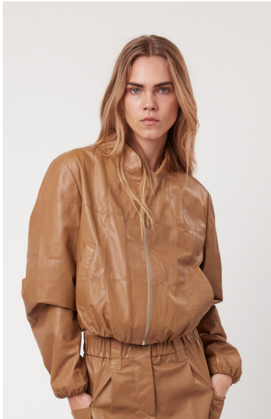
12514 JASIONE • Yako Plongê Napa • DPE-895 • 634 Primer • 480 € HLS • DPE-568 • 10 Black • 450 €