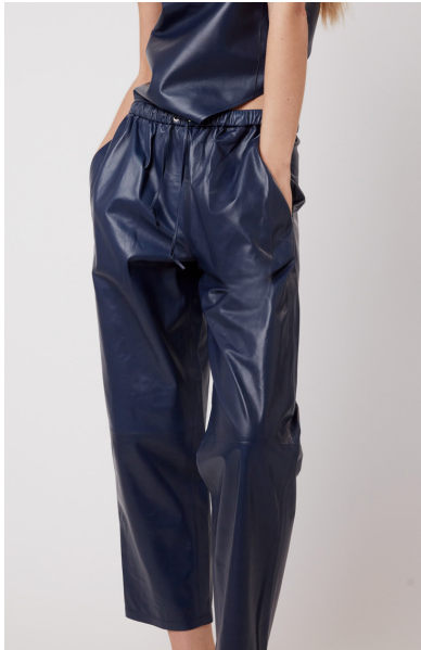
13505 PEONY • Lyra Ultra • DPE-875/03 • 45 Insignia Blue • 490 € HLS • DPE-568 • 10 Black • 440 €