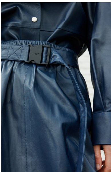
192 AMARYLLIS • Lyra • DPE-875 • 45 Insignia Blue • 80 €