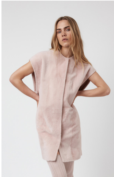
5637 VERVAIN • Lacon Short Hair • KM-1733 • 53 Dusty Rose • 720 € Baby Merino Sustainable • 650 €