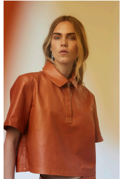
15763 BLUEBELL • Lyra • DPE-876 • 58 Dark Cheddar • 400 € HLS • DPE-568 • 10 Black • 290 €