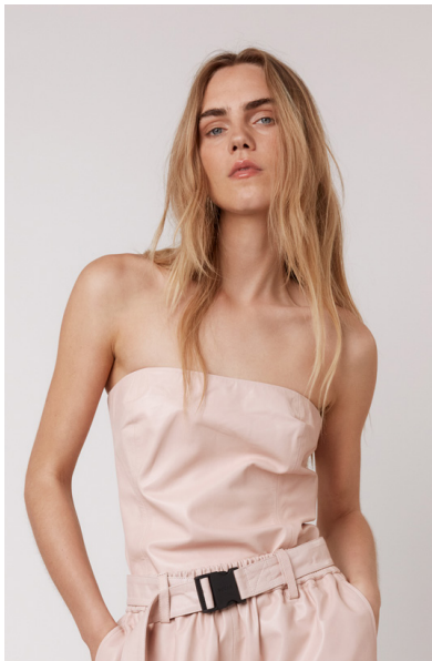
15764 TULIP • Sapphire Plongê Napa • DPE-856 • 53 Dusty Rose • 290 € HLS • DPE-568 • 10 Black • 180 €