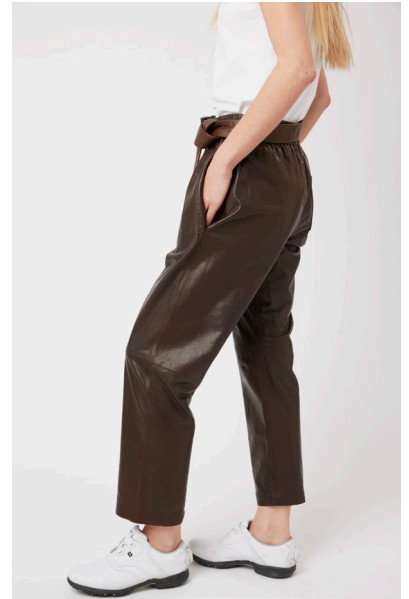
13507 PRIMULA • Manga Ultra • DP-285 • 632 French Roste • 490 € HLS • DPE-568 • 10 Black • 440 €