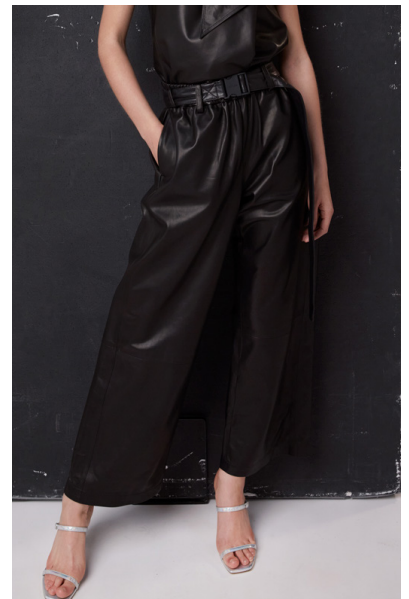
13509 PHACELIA • Vendôme Plongê Napa • DPE-894 • 10 Black • 520 € HLS • DPE-568 • 10 Black • 450 €