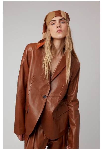
12510 JONQUIL • Lyra • DPE-871 • 633 Toasted Coconut • 670 € HLS • DPE-568 • 10 Black • 550 €