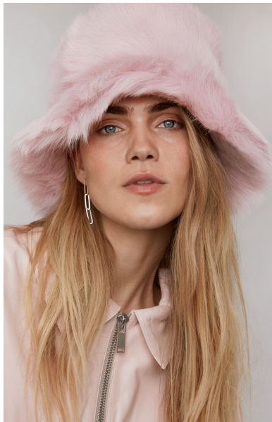
191 ASTER • Toscana Straight Hair • KT-1618 • 59 Chewing Gum • 200 €