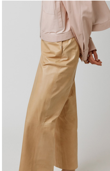
13506 PHLOX • Lyra Ultra • DPE-877/03 • 631 Hazelnut • 490 € HLS • DPE-568 • 10 Black • 440 €