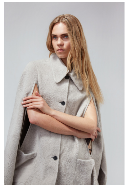
5635 VERBENA • Lacon Short Hair • KM- 1732 • 630 Oyster • 1.090 € Baby Merino Sustainable • 890 €