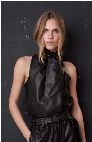
15765 TITHONIA • Vendôme Plongê Napa • DPE-894 • 10 Black • 450 € HLS • DPE-568 • 10 Black • 270 €