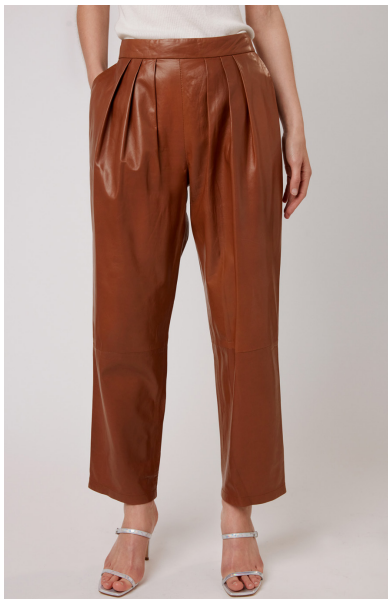
13508 PENSTEMON • Lyra Ultra • DPE- 871/03 • 633 Toasted Coconut • 490 € HLS • DPE-568 • 10 Black • 440 €