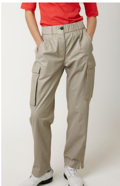
13510 PEACE • Lyra Ultra • DPE-872/03 • 630 Oyster • 550 € HLS • DPE-568 • 10 Black • 490 €