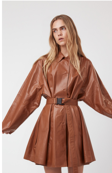
12515 JACARANDA • Lyra Ultra • DPE-871/03 • 633 Toasted Coconut • 950 € HLS • DPE-568 • 10 Black • 770 €