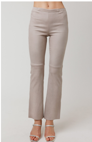
13501 LEA • Ela Grass • 53 Dusty Rose • 445 € • Ela Lamb • 490 € • Ela Lamb Color • 545 € • Ela Suede • 445 €