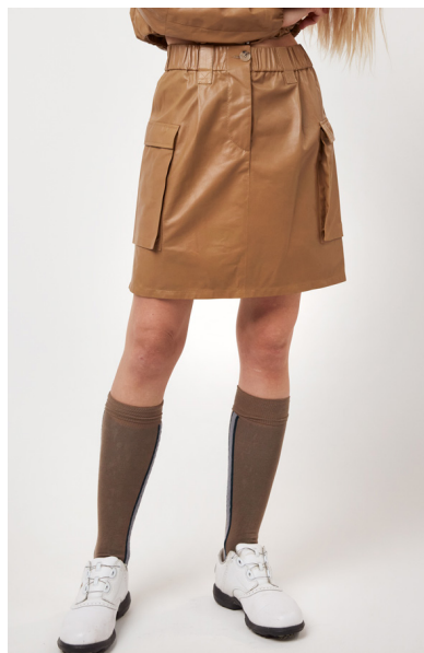
14413 NOLANA • Yako Plongê Napa • DPE-895 • 634 Primer • 350 € HLS • DPE-568 • 10 Black • 290 €