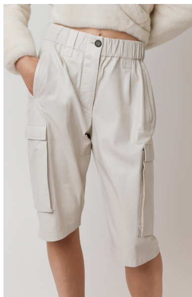
13511 PASSION • Lyra Ultra • DPE-874/03 • 27 Sugar • 490 € HLS • DPE-568 • 10 Black • 400 €