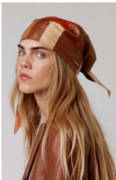
193 ALLIUM • Leather Patchwork • 58 Dark Cheddar, 633 Toasted Coconut, 631 Hazelnut & 634 Primer • 190 € Solid Lyra • 120 €