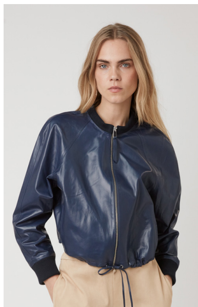
12512 JASMINIUM • Lyra Ultra • DPE- 875/03 • 45 Insignia Blue • 550 € HLS • DPE-568 • 10 Black • 450 €