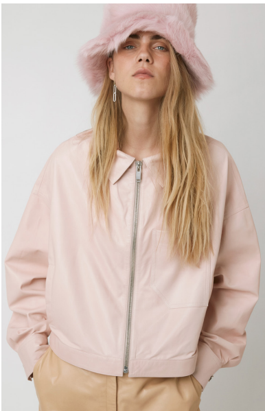
12508 JAMESIA • Sapphire Plongê Napa • DPE-856 • 53 Dusty Rose • 490 € HLS • DPE-568 • 10 Black • 450 €