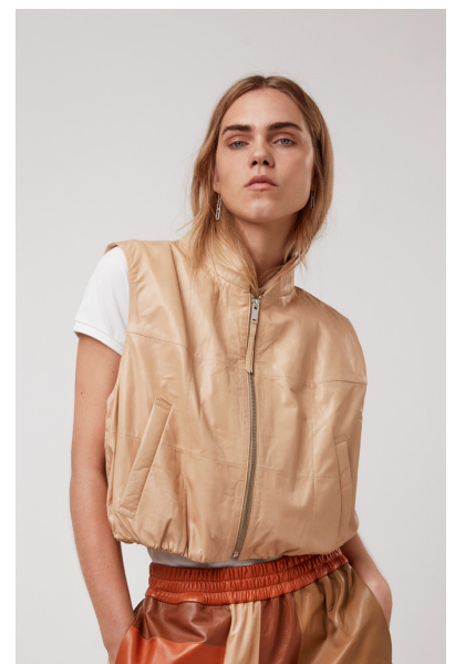
12513 VALERIANA • Lyra Ultra • DPE- 877/03 • 631 Hazelnut • 400 € HLS • DPE-568 • 10 Black • 350 €